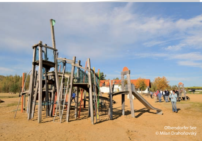
Olbersdorfer See

Rekreační areál Freizeitoase Olbersdorfer See nabízí rekreaci pro každého. Paleta možností je široká a sahá od turistiky, koupání, plavání přes plážový volejbal, nabízí i samostatné cyklostezky, ale i módní sporty jako surfování a nordic walking.