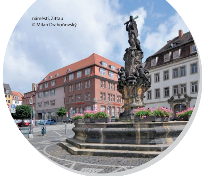
náměstí, Žittau © Milan Drahoňovský