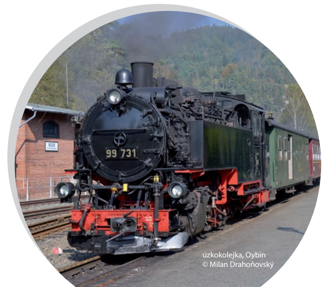
úzkokolejka, Oybin

Okolí Oybinu je doslova stvořeno pro výlety. Vydáte-li se kterýmkoliv směrem, narazíte jistě na jednu z mnoha vyhlídek.