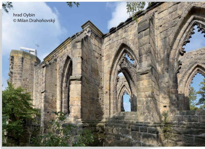
hrad Oybin