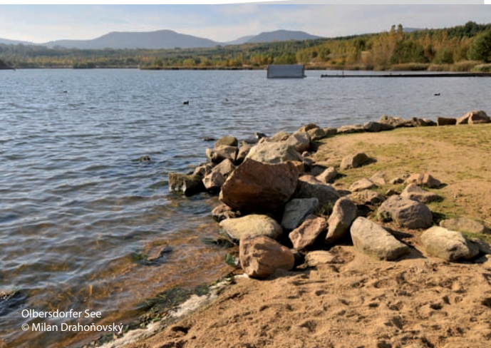
Olbersdorfer See