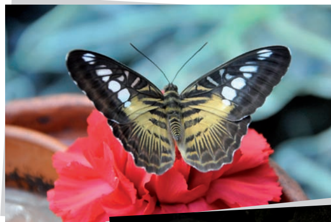
Motýlí dům, Kurort Jonsdorf

Lázeňské středisko v Chráněné krajinné oblasti Žitavské hory leží nedaleko Žitavy. Mimo jiné zde můžete navštívit Motýlí dům nebo Mořské akvárium. Nedaleko v pískovcových skalách Nonnenfelsen se nachází několik výukových, dobře jištěných ferratových cest.