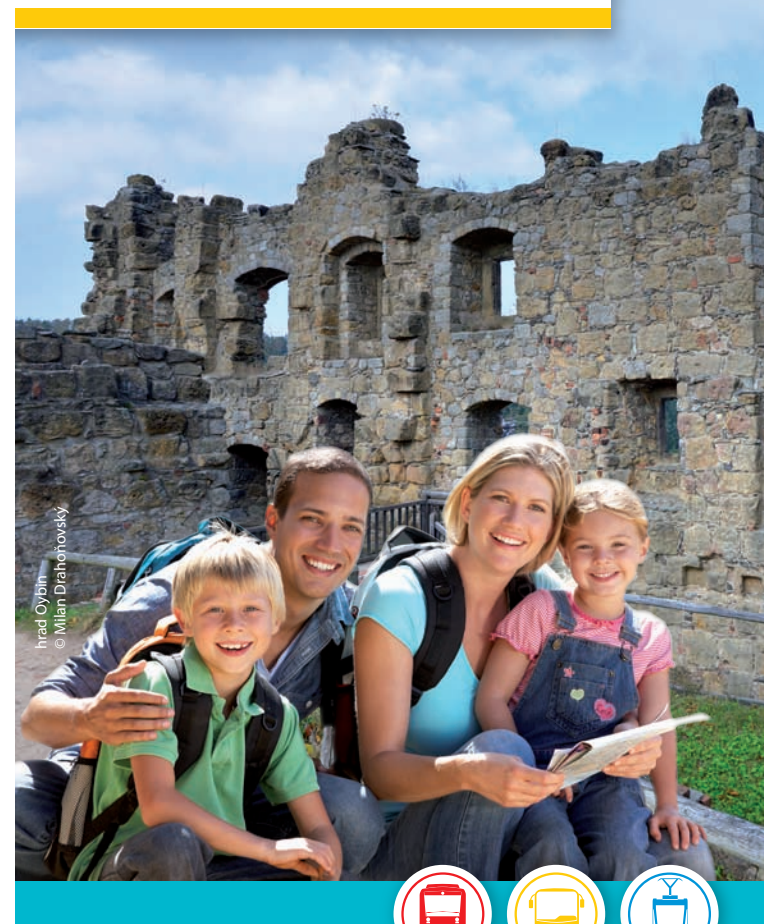
Hrad Oybin