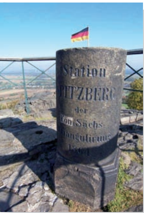
vrchol hory Spitzberg, Oderwitz

Obec Oderwitz patří díky výborné krajinné poloze a mnoha pěkně renovovanými podstávkovými domy k nejkrásnějším vesnicím v Horní Lužici. K tomu je Oderwitz jediným místem v celém Německu, kde se nacházejí hned tři restaurované větrné mlýny německého typu.