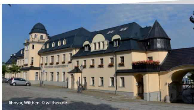
lihovar, Wilthen

Pro pěší turisty je ve Wilthenu a jeho okolí připravena značená trasa Po stopách Pumphuta o celkové délce 17 km. Martin Pumphut je legendární postava z Horní Lužice – mlynářský chlapec se špičatým kloboukem a magickými schopnostmi. To mu vyneslo přezdívku „čaroděj Horní Lužice“. Pumphut je také symbolem Wilthenu a stojí zde jeho velká dřevěná socha.