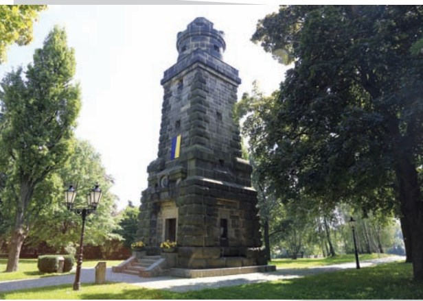
Bismarckova věž, Neugersdorf