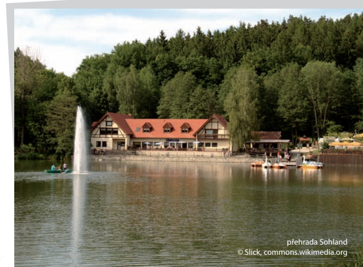
přehrada Sohland