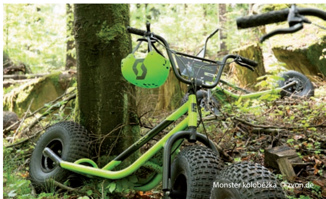
Monster koloběžka

Poklidné město Neukirch v Horní Lužici je známé i svými tradičními výrobky jako suchary Neukircher Zwieback a četnými ručně vyráběnými produkty z místních hrnčířských dílen.