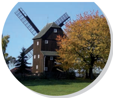
větrný mlýn Berndt Mühle, Oderwitz