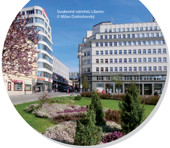
Soukenné náměstí, Liberec