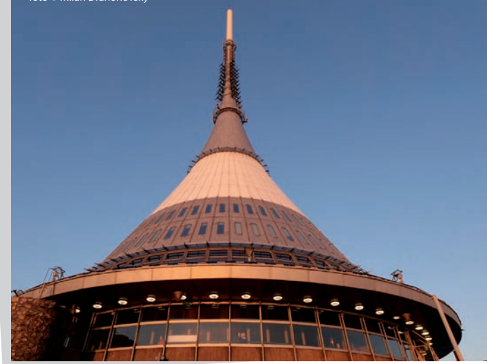
Vysílač a hotel Ještěd © Karel Hubáček – dědicové 1963

Na Ještědském hřebenu je také skiareál, snadno dostupný z města.