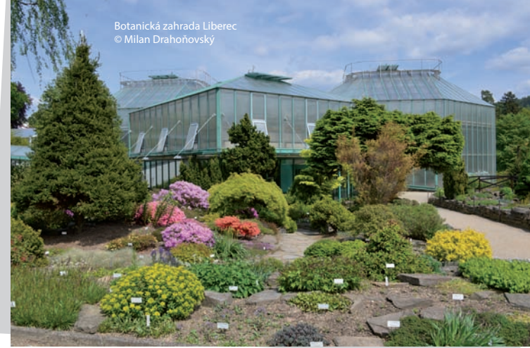
Botanická zahrada Liberec