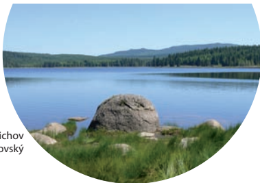
vodní nádrž Bedřichov

možnost přestupu na jiný spoj (autobus, vlak, tramvaj) v dosahu je turistické informační centrum zastávka se nachází u cyklotrasy číslo ... možnost východního bodu pěší cesty k turistickým důlům (u zastávky vede vyznačená cesta) zastávka se nachází u naučné stezky přístup na jiný spoj