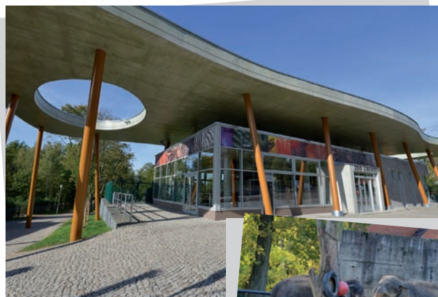
ZOO Liberec, 2x © Milan Drahoňovský

Zoologická zahrada nabízí zážitkový vzdělávací program, kdy se na celý den nebo půlden stanete ošetřovatelem. Zájemci starší 15 let si vyzkouší, jaké to je pečovat o exotická zvířata. Součástí ZOO Liberec je také záchraná stanice ARCHA. Ta poskytuje pomoc handicapovaným volně žijícím zvířatům, která jsou v důsledku zranění, nemoci či jiných okolností dočasně či trvale neschopna přežít ve volné přírodě.