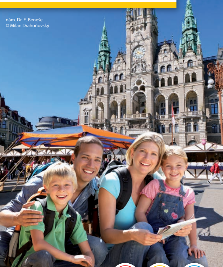
nám. Dr. E. Beneše