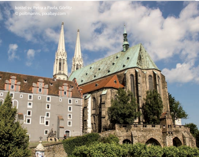
kostel sv. Petra a Pavla, Görlitz

Historické centrum, v němž se zachovalo asi 4 000 památkových objektů ze všech hlavních fází středoevropských architektonických stylů (pozdně gotický, renesanční a barokní sakrální), je označováno za nejrozsáhlejší památkovou rezervaci v Německu. Úchvatná scenérie města fascinuje nejen návštěvníky, ale přitahuje pravidelně i německé a zahraniční filmové producenty.