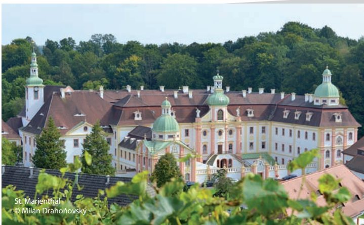
St. Marienthal

Velkolepou červeno-bílou budovu kláštera si lze nejlépe prohlédnout z Křížové hory (Kalvárijská hora) nad vinicemi, na které stojí sousoší Ukřížování a po níž vede křížová cesta.