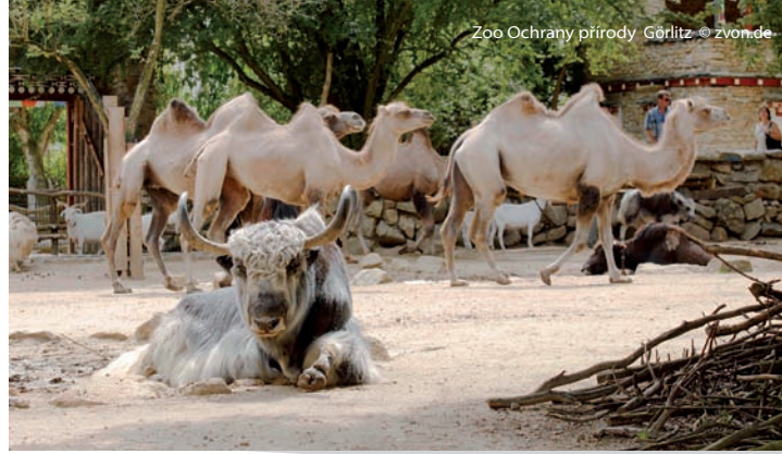
Zoo Ochrany přírody Görlitz

Pro mnohé je lužická oblast NEISSELAND severně od Görlitz tajným favoritem. Ať už chcete být aktivní, relaxovat nebo se oddat kultuře, oblast NEISSELAND nabízí jedinečné zážitky pro vaši rekreaci. Tento region mnoha tváří se rozprostírá podél řeky Nisy mezi parkem Fürst-Pückler-Park v Bad Muskau, který je součástí světového kulturního dědictví UNESCO, a klášterem St. Marienthal v Ostritz, nejstarším opatstvím ženského cisterciáckého řádu v Německu.