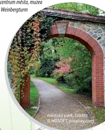
městský park, Görlitz