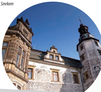
hrad a zámek Frýdlant, 2x © Milan Drahoňovský