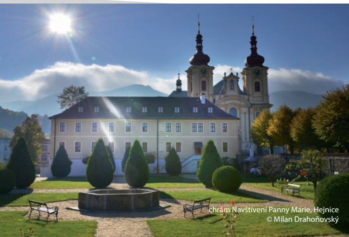
chrám Navštívení Panny Marie, Hejnice

V Hejnicích lze vedle chrámové dominanty navštívit Muzeum horolezectví , projít se do nedalekých Lázní Libverda , občerstvit se v restauraci Obří sud či navštívit arboretum ve Ferdinandově.