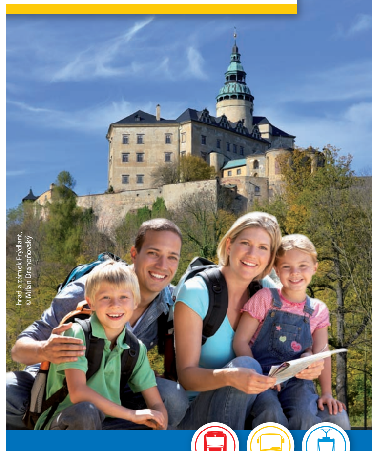
hrad a zámek Frydlant