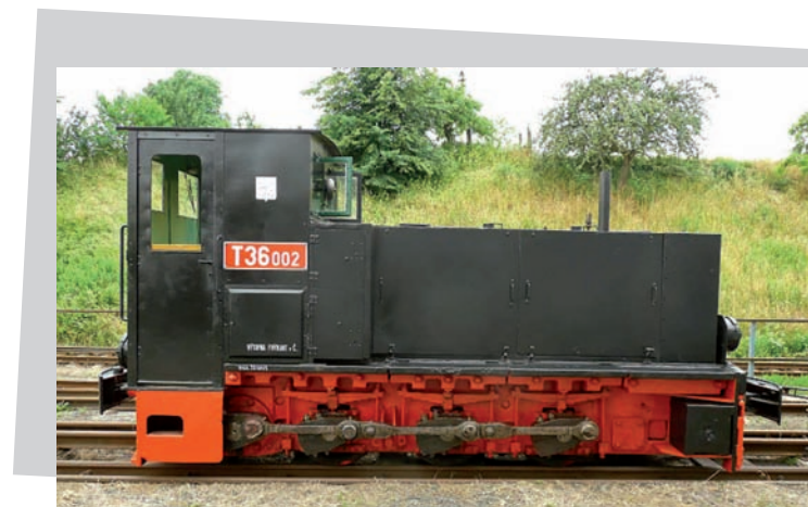
muzeum Heřmanička, Frýdlant