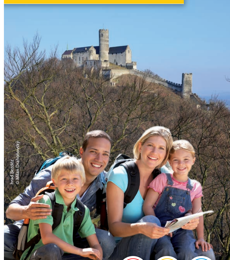
hrad Bezděz