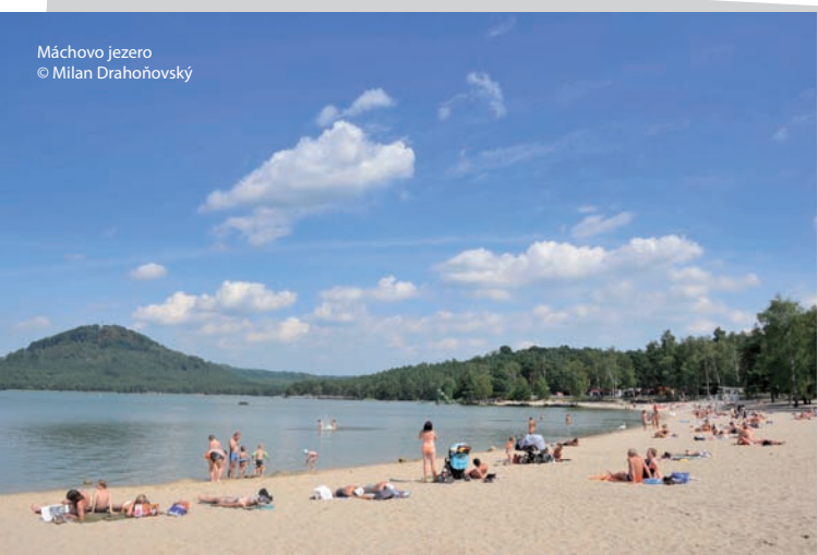
Máchovo jezero