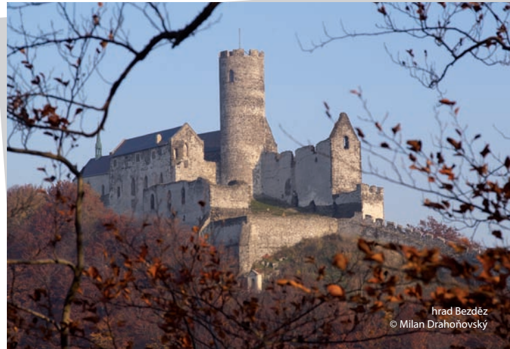
hrad Bezděz

Pod hrad i k Máchovu jezeru se dostanete vlakem, kterým pohodlně přepravíte i svá kola, nebo autobusem. Zbytek již zvládnete po turistických trasách a cykloznačení.