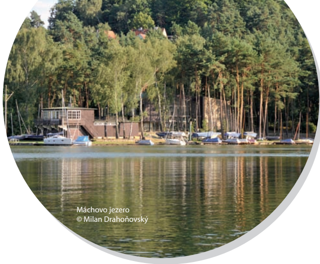
Máchovo jezero