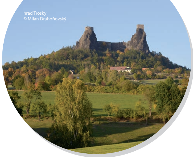
hrad Trosky