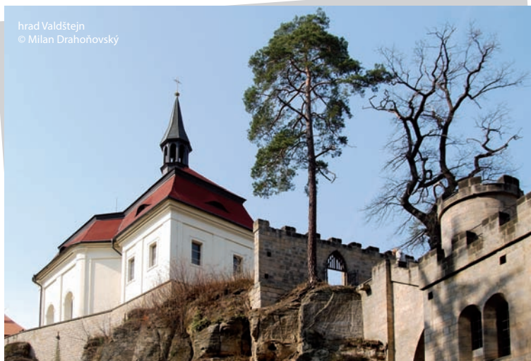
hrad Valdštejn

Při úpravách v 19. století byla na konci hradu vybudována vyhlídka na Trosky a blízké skalní město. Krásné výhledy na okolní krajinu se nabízejí i z dalších míst hradu.