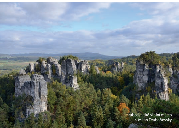
Hruboskalské skalní město

Při poznávání Hruboskalska můžete navštívit několik míst, kde se natáčely známé české filmy a pohádky. Skalní město je též nejvyhledávanějším místem horolezců.