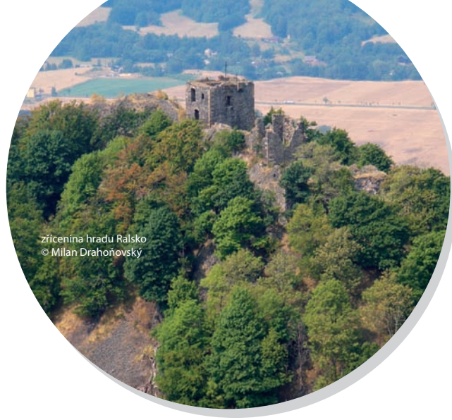
zřícenina hradu Ralsko