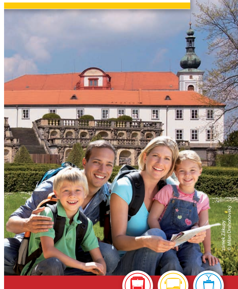
zámek Zákupy