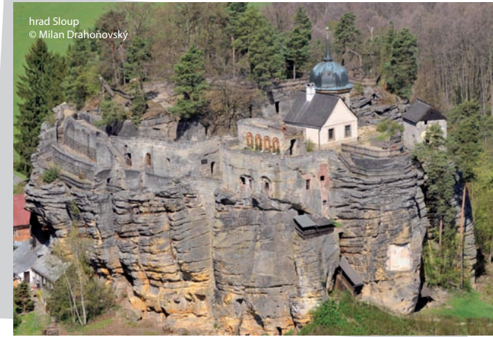
hrad Sloup

Krásnou scénérií této stezky je údolí Kamenického potoka. Jednou ze zastávek je léčivý pramen Tří svatých. Už v roce 1709 se údajně k tomuto léčivému prameni konala procesí.