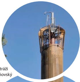
rozhledna Na Stráži