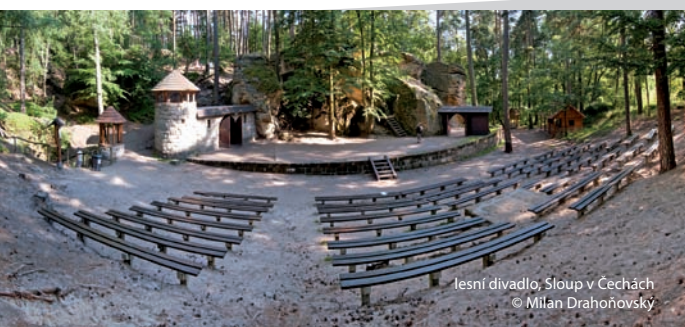
lesní divadlo, Sloup v Čechách