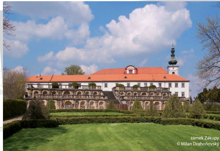
zámek Zákupy

Oblíbeným místem Sloupu je koupaliště na břehu Radvaneckého rybníka.