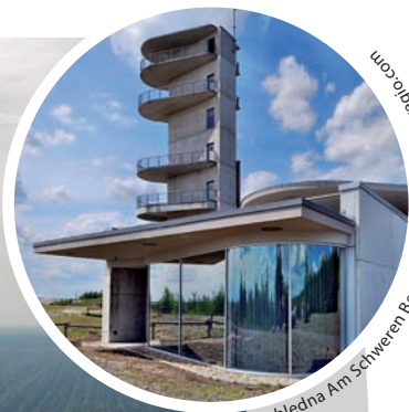
rozhledna Am Schwersen Berg