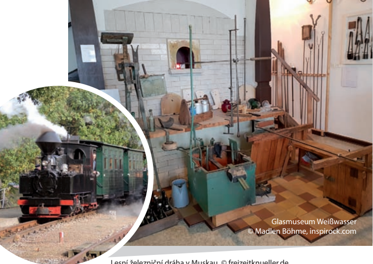
Glasmuseum Weißwasser