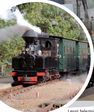
Lesní železniční dráha v Muskau

Lesní železniční dráha v Muskau je úzkorozchodná trať o rozchodu 600 milimetrů. Spojuje saská města Weißwasser, Kromlau a Bad Muskau. Vlaky po obou provozovaných tratích (z Weisswasseru do Kromlau nebo do Bad Muskau) tahají diesellové lokomotivy či zrekonstruované parní lokomotivy. Ve stanici „Železniční park střed“ je otevřena výstava historických železničních vozů.